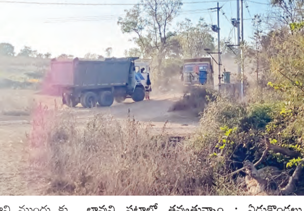
గాని ముందు కు రావడం లేదని ఆరోపిస్తున్నారు.

మట్టి, కంకర తరలింపులో రాత్రి అనక పగలు అనక టిప్పర్లలో మట్టిని జోరుగా తరలిస్తున్నారు. దీంతో చుట్టుపక్కల చుట్టూ పక్కల ఉండి పచ్చని పొలాలు నాశనం అవుతున్నాయని రైతులు ఆవేదన వ్యక్తం చేస్తున్నారు.