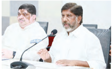
ఓబిసిలకు రిజర్వేషన్ల కోసం వివిధ పార్టీల నాయకుల అభిప్రాయాలను తీసుకొని, రిజర్వేషన్లపై కలిసి వచ్చే పార్టీలను కలుపుకొని పోరాడమని తెలిపారు. ఇక కొందరు ఉద్దేశభూయ కంగా ఈ సర్వేలో వివరాలు తరువాతి పేజీ

ప్రజాపక్షం/హైదరాబాద్ రాష్ట్రంలో కులగణన సర్వేలో పాల్గొనని వారి కోసం మరో సారి కుల గణన సర్వే నిర్వహిస్తామని ఉపముఖ్యమంత్రి పుల్లారాజు విక్రమార్య వెల్లడించారు. ఈనెల 16 నుంచి 28వ తేదీ వరకు ఈ సర్వే నిర్వహిస్తామని ఆయన తెలిపారు. బిసిలకు 42 శాతం రిజర్వేషన్లు కల్పించే విషయంలో మార్పులో కేబినెట్ తీర్మానం చేసి, సంబంధిత బిల్లుకు శాసనసభలో ఆమోదంతో చట్టబద్ధం చేయాలని నిర్ణయం తీసుకున్నామన్నారు. సచివాలయంలో బుధవారం బిసి సంక్షేమ మంత్రి పాస్కం ప్రభాకర్ తో కలిసి ఏర్పాటు చేసిన విలేకరుల సమావేశంలో భట్టి విక్రమార్య మాట్లాడుతూ కులగణన బిల్లును కేంద్ర ప్రభుత్వానికి పంపి, ఒత్తిడి తెచ్చి పార్లమెంటులో ఆమోదానికి కృషి చేస్తామని చెప్పారు.