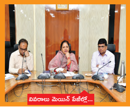
వివరాలు మెయిన్ పేజీలో...