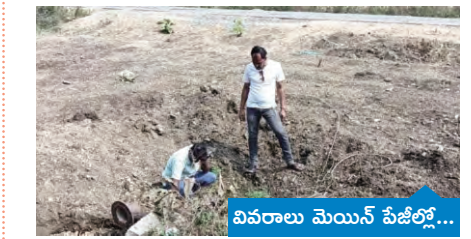
వివరాలు మెయిన్ పేజీలో...

ఆర్వి టూర్స్ అండ్ ట్రావెల్స్ కార్యాలయం ప్రారంభం ఉత్తర తెలంగాణకు విస్తరించడం అభినందనీయం - సింగర్ మధుప్రియ