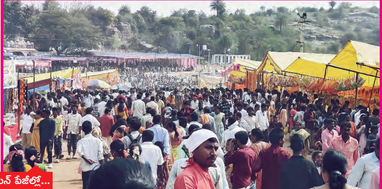
వివరాలు మెయిన్ పేజీలో...

పల్లెలో చేర్చి రథోత్సవాన్ని కన్నుల పండుగగా నిర్వహించారు. ఈ కార్యక్రమానికి భక్తులు పెద్ద ఎత్తున హాజరైన గంగాపూర్ వాగుకు ఖరువైచారా చేరి రథోత్సవాన్ని తిలకరించారు.