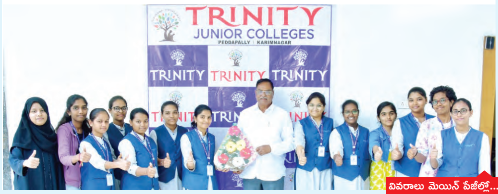
వివరాలు మెయిన్ పేజీలో...