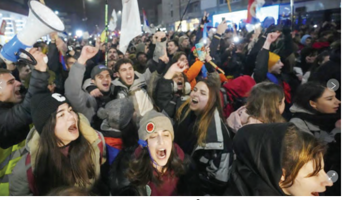
సెర్బియాలో పోటోపోటీ ర్యాలీలు

క్రొవేషియా (సెర్బియా) : అవినీతికి వ్యతిరేకంగా విద్యార్థులు... ప్రభుత్వ విధానాలను సమర్థిస్తున్న అనుకూల వర్గాల పోటోపోటీ ర్యాలీలతో సెర్బియా నగరం క్రొవేషియాలో హోరెత్తిపోయింది. గత ఏడాది నవంబర్ ఒకటోతేదీన, నావిసాద్ నగరంలోని రైల్వే స్టేషన్ కున్నకూల దండ్రి 15 మంది మృతి చెందిన ఘటనపై విద్యార్థులు ఆగ్రహం వ్యక్తం చేస్తున్నారు. ప్రభుత్వ నిర్లక్ష్యం, అధికారుల అవినీతి కారణంగానే ఇలాంటి ప్రమాదాలు చోటుచేసుకుంటున్నాయని ఆరోపిస్తున్నారు. కొంతకాలంగా నిరసనలు వ్యక్తం చేస్తున్న విద్యార్థులు, ఈనెల 15వ తేదీ శనివారం భారీ ర్యాలీకి పిలుపునిచ్చడంతో, వేలాది మంది తరలి