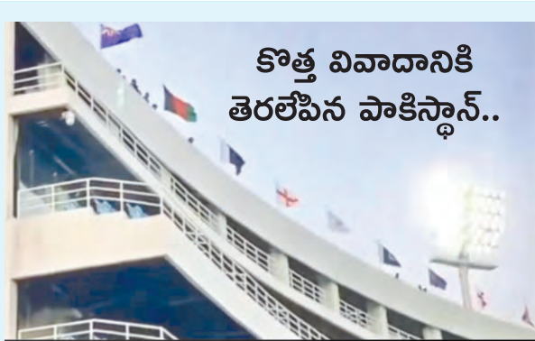
కొత్త వివాదానికి తెరలేపిన పాకిస్థాన్..