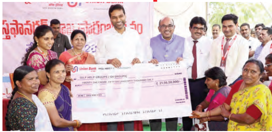
- బ్యాంకింగ్ లావాదేవీలపై అవగాహన పెంచుకోవాలి - యూనియన్ బ్యాంక్ బ్రాంచ్‌ను ప్రారంభించిన కలెక్టర్