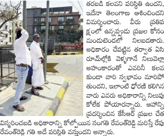
తరబడి కలవని పరిస్థితి ఉందని, ఇదేనా తెలంగాణ ఆశించిందని విమర్శించారు. వీరు ప్రతిపక్షంలో ఉన్నప్పుడు ప్రజల కోసం ముందుబెండ్లో నిలబడతారు. అధికారం చేపట్టిన తర్వాత ఏసి రూమ్ లోకి వెళ్ళగానే నిలువెల్లా అహంకారంతో ఎవరినీ కలవకుండా వారి స్వభావం మారిపోతుందని, ఇలాంటి ధోరణి కలిగిన వారు ఎవరు అధికారాన్ని నిలుపుకోలేక పోయారన్నారు. ఆహాన్ని ప్రదర్శించిన కేసిఆర్ ప్రజల చేత విస్మరించబడి అధికారాన్ని కోల్పోయిన సంగతి రేవంత్ రెడ్డి మరిస్తే రేపు రేవంత్ రెడ్డి గతి అదే పరిస్థితి వస్తుందని అన్నారు.