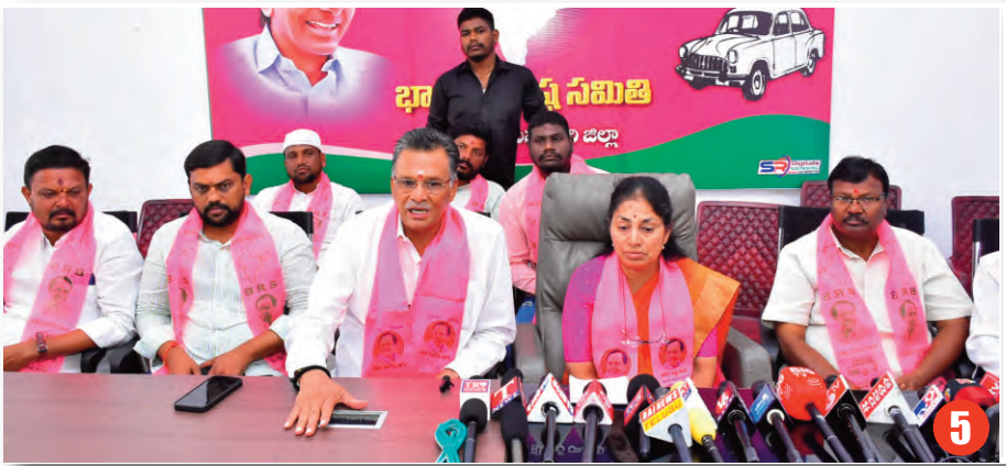
ఆంధ్రకు వెళ్లే నీటిని ఆపాలి