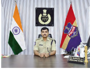
31 వరకు ) జిల్లా వ్యాప్తంగా 30(30 ఎ) పోలీసు యాక్ట్ 1861 అమలులో