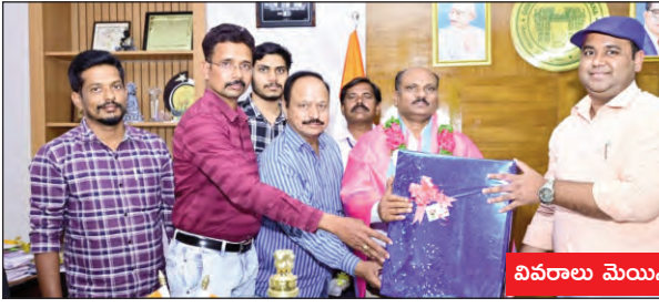
వివరాలు మెయిన్ లో...