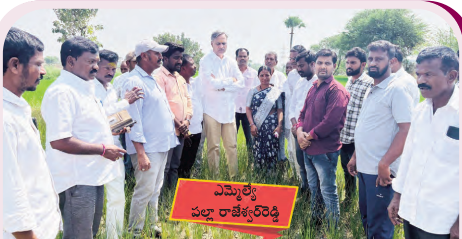
ఎమ్మెల్యే పల్లారాజేశ్వర్ రెడ్డి