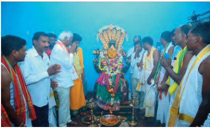
పూజాకార్యక్రమంలో పాల్గొని ఎల్లమ్మతల్లి దీవెలసతో