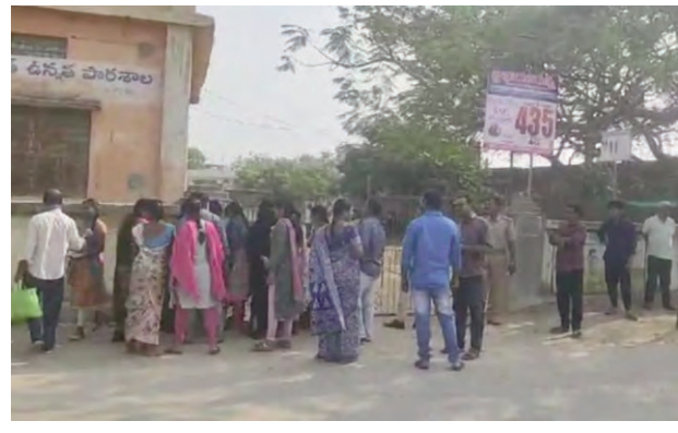
బాన్సువాడ :బాన్సువాడ మండలంలో పదవ తరగతి పరీక్షలు శుక్రవారం

నిజాంసాగర్:10వ తరగతి పరీక్షలు శుక్రవారం ప్రారంభం కాగా విద్యార్థులు ప్రశాంత వాతావరణంలో పరీక్ష రాశారు. నిజాంసాగర్ మండలంలోని జిల్లాపరిషత్ ఉన్నత పాఠశాలలో మొత్తం 149 మంది విద్యార్థులకు గాను పూర్తిస్థాయిలో 149 మంది విద్యార్థులు హాజరయ్యారు. అదేవిధంగా తెలంగాణ మోడల్ స్కూల్లో 189 మందికి గాను 189 మంది విద్యార్థులు పరీక్షలు రాశారని విద్యాశాఖ అధికారి ఒక ప్రకటన ద్వారా తెలిపారు.