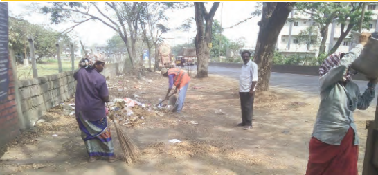
-పారిశుధ్యం అస్తవ్యస్తం కథనానికి స్పందించిన ఎమ్మెల్యే

ప్రజాపక్షం/ఖమ్మం : పారిశుధ్య పనుల పట్ల నిర్లక్ష్యం వహిస్తే సహించేదిలేదంటూ వైరా ఎమ్మెల్యే మాకోత్ రాందాస్ నాయక్ అధికారులను ఆదేశించారు. ప్రజాపక్షం దినపత్రికలో పారిశుధ్యం అస్తవ్యస్తం అనే కథనానికి స్పందించిన ఎమ్మెల్యే రాందాస్ నాయక్ మున్సిపాలిటీ పరిధిలోని అన్ని వార్డుల్లో పారిశుధ్య పనులు సక్రమంగా జరగాలని అన్నారు. నిర్లక్ష్యం వహిస్తే సహించేదిలేదని ఆయన ఆదేశించారు. ఎమ్మెల్యే ఆదేశాలతో అధికారులు పలు ప్రాంతాల్లో పారిశుధ్యాన్ని తొలగించారు. గత కొన్ని రోజులుగా వైరా మున్సిపాలిటీలో అస్తవ్యస్తంగా పారిశుధ్య పనులు కొనసాగుతున్నాయి. ఇదే విషయాన్ని ప్రజలనుంచి వివరాలు సేకరించిన ప్రజాపక్షం ప్రచురించింది. త్వరలోనే వైరా మున్సిపాలిటీలో అధికారులతో ఎమ్మెల్యే పారిశుధ్య పనులపై ప్రత్యేక సమీక్ష నిర్వహించున్నారు. మున్సిపాలిటీలో ఎలాంటి ఇబ్బందులు కలగకుండా ఉండటే ఇందిరమ్మ ప్రభుత్వం ధ్యేయమని అన్నారు. ప్రజలకు మంచి పాలన అందించాలనే ఉద్దేశ్యంతో ఇందిరమ్మ ప్రభుత్వం ముందుకు కొనసాగుతుందని అధికారులు ఎక్కడైనా నిర్లక్ష్యం వహిస్తే చర్యలు తప్పవని తెలిపారు.