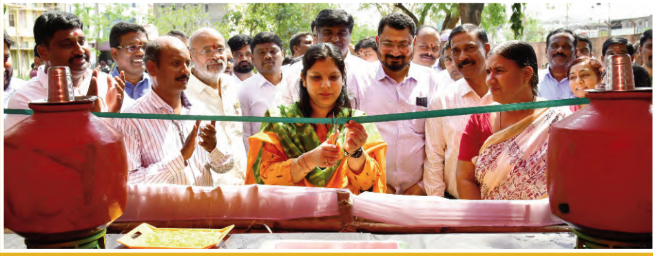
కలెక్టరేట్లో చలివేంద్రం ప్రారంభం 2