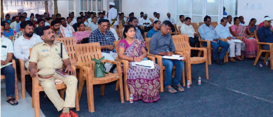
కార యంత్రాంగం చర్యలను మొదలుపెట్టింది. వరి ఎక్కువగా వస్తుందని పచ్చి పంటను కోయడం నేరంగా పంటను అపరిపక్వంగా కోయడం ద్వారా, తాలు శాతం పరిగణించబడుతుందని, దాని కొరకు హార్వెస్టర్ యజమా