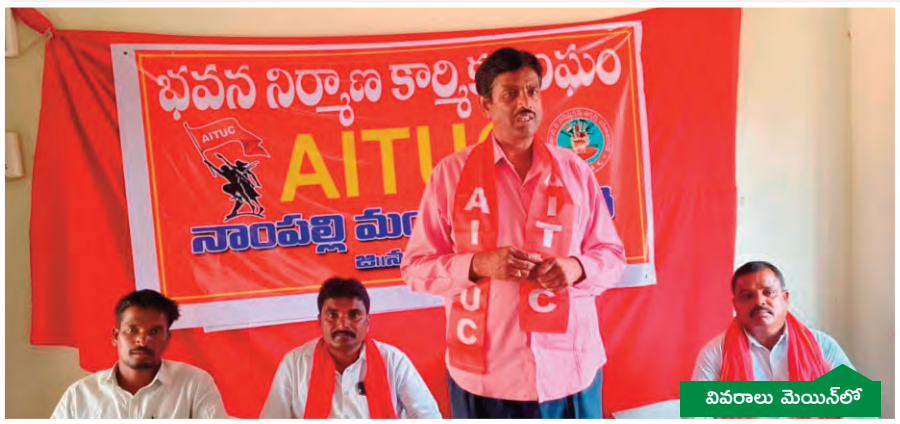
కార్మిక సంక్షేమ బోర్డు పరిరక్షణ కోసం ఉద్యమించాలి