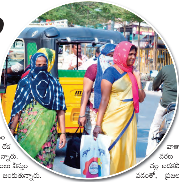
వాతావరణ చల్లబడకపోవడంతో, ప్రజలు ఇబ్బందులకు గురవుతున్నారు. వడగాలులు, ఉక్కపోతతో కంటి మీద కునుకులేకుండా ప్రజలు అవస్థలకు గురవుతున్నారు. వర్షాలు కురిసేగాని వాతావరణ చల్లబడే అవకాశం ఉంది. అప్పటి వరకు ప్రజలకు అవస్థలు తప్పే పరిస్థితి కనబడడం లేదు., మార్చిలోనే ఎండలు ఈ విధంగా ఉంటే ఏప్రిల్, మే నెలలో ఎండల ఈ విధంగా ఉంటాయి అని ప్రజలు భయపడుతున్నారు,

ఒక్కసారిగా భానుడు ఉగ్రరూపం దాల్చడంతో ప్రజలు బయటకు వెళ్ల లేక చాలా మంది ఇళ్లకే పరిమితమవుతున్నారు. ఉదయం 9 గంటల నుంచే వడ గాలులు వీస్తుండంతో బయటకు వెళ్లా లంటే జంకుతున్నారు. మధ్యాహ్నం 12 ఎండ తీవ్రతతో గడియారం సెంటర్ తో పాటు పలు ప్రధాన రోడ్లన్నీ సాయంత్రం 5 గంటల వరకు రోడ్లన్నీ నిర్మానుష్యంగా మారుతున్నాయి. పనిమీద బయటకు వెళ్లాలనుకునే వారు మాత్రం సాయంత్రం 5 తరువాతే బయటకు వెళ్తున్నారు. దీంతో పాటు మధ్యాహ్నం 12 గంటల ప్రాంతంలో కొన్ని ప్రాంతాల్లో విద్యుత్ కోత విధిస్తుండడంతో చిన్నపిల్లలు, వృద్ధులు అల్లాడిపోతున్నారు. రాత్రి పది గంటల వరకు కూడా