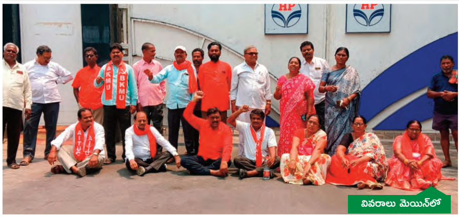
వివరాలు మొయిన్ లో