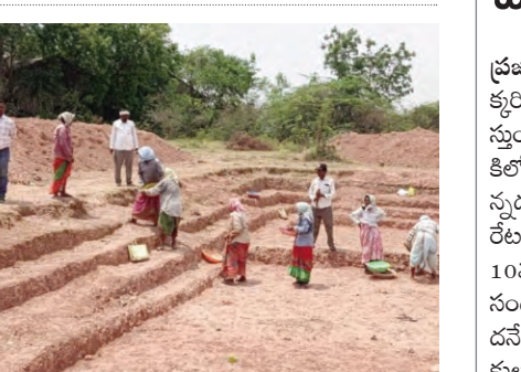
టెక్నికల్, ఫీల్డ్ అసిస్టెంట్లు, సీసీలు, పంచాయతీ కార్యదర్శులు పాల్గొన్నారు.