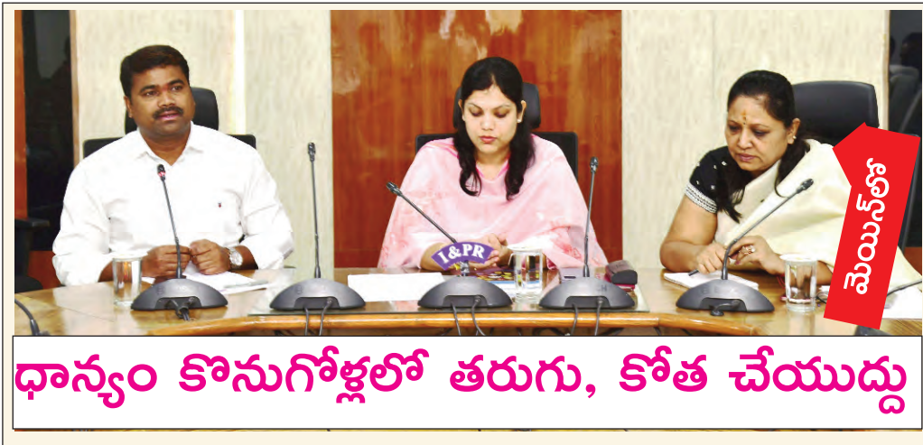
ధాన్యం కొనుగోళ్లలో తరుగు, కోత చేయుద్దు