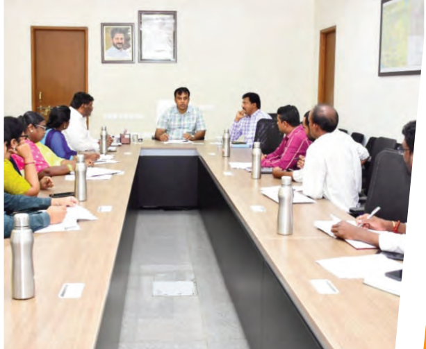
ధాన్యం కొనుగోలు ప్రక్రియ