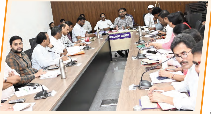
కలెక్టర్ కోయ శ్రీ హర్ష

ప్రజాపక్షం/పెద్దపల్లి ప్రతినిధి : తెలంగాణ ప్రజలకు ఉన్న భూ సమస్యల పరిష్కారం కోసం ప్రజా ప్రభుత్వం నూతనంగా తీసుకుని వచ్చిన భూ భారతి ఆర్డోఆర్ చట్టం పై విస్తృతంగా ప్రచారం కల్పించాలని జిల్లా కలెక్టర్ కోయ శ్రీ హర్ష అన్నారు. మంగళవారం సమీకృత జిల్లా కలెక్టరేట్ లోని సమావేశ మందిరంలో జిల్లా కలెక్టర్ కోయ శ్రీ హర్ష భూ భారతి చట్టం అమలు పై అదనపు కలెక్టర్ డి.వేణు తో కలిసి సంబంధిత అధికారులతో సమీక్ష నిర్వహించారు. ఈ సందర్భంగా మాట్లాడుతూ సిఎం ప్రజావాణి దరఖాస్తులను ఇంకా నుంచి ప్రతి వారం స్క్రాటింగ్ చేయడం జరుగుతుందని, వాటి సత్వర పరిష్కారానికి చర్యలు తీసుకోవాలని కలెక్టర్ తెలిపారు. భూ భారతి చట్టం పై తహసీల్దారులు రెవెన్యూ అధికారులు సంపూర్ణ అవగాహన కలిగి ఉండాలని అన్నారు. భూ భారతి చట్టం యొక్క గెజిట్, రూల్స్ ను రెవెన్యూ శాఖ లో ప్రతి అధికారి తెలుసుకోవాలని అన్నారు. భూ భారతి చట్టంలో రెండంచెల అప్యిల్ వ్యవస్థ ఉందని అన్నారు. భూ పరిధి చట్టం ప్రకారం ఇకపై రిజిస్ట్రేషన్, మ్యూటీషన్ చేసే సమయంలో సర్వే మ్యాప్ తప్పనిసరి అవుతుందని అన్నారు. ఏప్రిల్ 17 నుంచి ఏప్రిల్ 30 వరకు నూతన భూ భారతి ఆర్డోఆర్ చట్టం పై అవగాహన కార్యక్రమాలు నిర్వహించాలని, దీనికి సంబంధించిన షెడ్యూలు, వెన్యూ లను తయారు చేసుకోవాలని అన్నారు. ప్రతి రోజు కనీసం 2 అవగాహన కార్యక్రమాలు జరగాలని, ప్రతి అసెంబ్లీ నియోజకవర్గ పరిధిలో ఈ అవగాహన కార్యక్రమాలు నిర్వహించాలని అన్నారు. స్థానిక ప్రజా ప్రతినిధులు, రైతులు, ఇతర ప్రజలు ఈ సమావేశాలకు హాజరయ్యేలా చూడాలని కలెక్టర్ సంబంధిత అధికారులకు సూచించారు. భూ భారతి చట్టం ముందస్తుగా రాష్ట్రంలోని నాలుగు మండలాల్లో పైలెట్ ప్రాజెక్టు కింద ప్రారంభించి, అక్కడ ప్రజల నుంచి దరఖాస్తులు స్వీకరించి వాటిని పరిష్కరించి