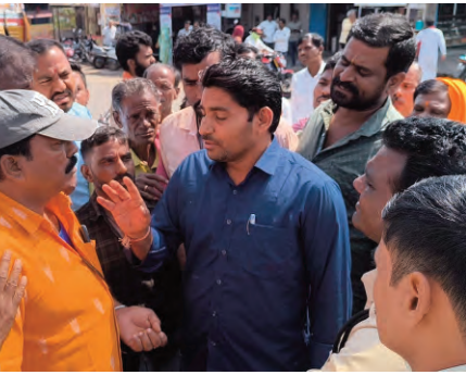
కొని సిబ్బంది తప్పించి వల్ల ఫ్లెక్సీ తొలగించడం జరిగిం దని నూతన ఫ్లెక్సీని తయారు చేయించి ఆ స్థలంలో ఏర్పాటు చేస్తామని హామీనివ్వడంతో గొడవ సద్దుమణి గింది.