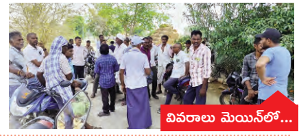
వివరాలు మెయిన్ లో...