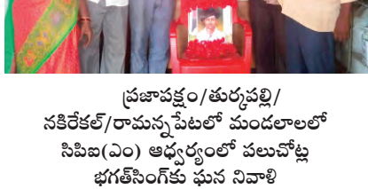
ప్రజాపక్షం/తుర్కపల్లి/నకిరేకల్/రామన్నపేటలో మండలాలలో సిపిఐ(ఎం) ఆధ్వర్యంలో పలుచోట్ల భగత్ సింగ్ కు ఘన నివాళి