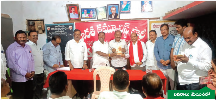
వివరాలు మొయిన్ లో

న్యాయ వ్యవస్థలో ప్రజాస్వరం సామూల రామిరెడ్డి