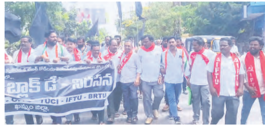
కార్మిక వర్గం పోరాడి సాధించుకున్న 44 కార్మిక చట్టాలలో 29 చట్టాలను పూర్తిగా రద్దు చేసి వాటి స్థానంలో కార్మికులకు వ్యతిరేకంగా యాజమాన్యాలకు అనుకూలంగా కేంద్రంలోని మోడీ ప్రభుత్వం నాలుగు లేబర్ కోడ్లను తీసుకువచ్చింది.

ప్రజాపక్షం/ ఖమ్మం అర్చన : కార్మికులు పోరాడి సాధించుకున్న హక్కులను కాలరాస్తూ కేంద్ర ప్రభుత్వం తీసుకువచ్చిన నాలుగు లేబర్ కోడ్లను వెంటనే రద్దు చేయాలని అఖిలపక్ష కార్మిక సంఘాల నాయకులు డిమాండ్ చేశారు.