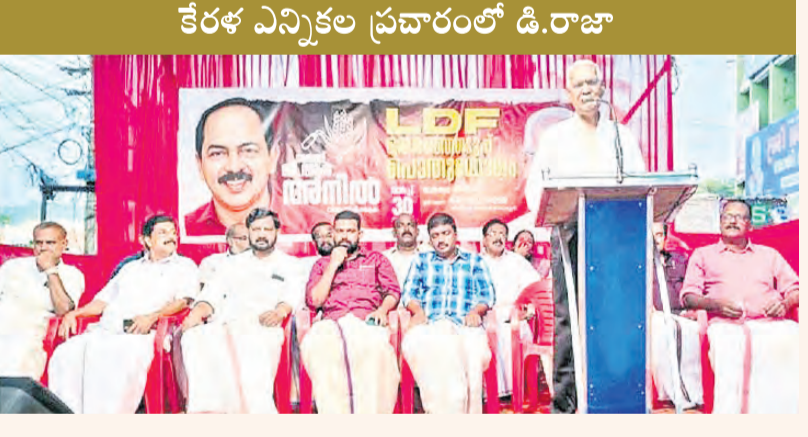
కేరళ ఎన్నికల ప్రచారంలో డి.రాజా

ఎల్డిఎఫ్ కు పెరుగుతున్న ఆదరణతో యుడిఎఫ్, బిజెపి బెంబేలు కేరళలో మోడీ, యుడిఎఫ్ ఇరువురిని ఒకే రాజకీయ కీడు భాష, లక్ష్యాలు ఉన్నట్లు కనిపిస్తున్నాయని, ఎందుకంటే వీరిద్దరికీ అసలైన రాజకీయ ప్రత్యర్థి వామపక్ష ప్రజాశక్తం సంఘటన (ఎల్డిఎఫ్) మాత్రమేనని సిపిఐ జాతీయ ప్రధాన కార్యదర్శి డి.రాజా అన్నారు. కేరళలో ఎల్డిఎఫ్ ను బలహీనపరిచేందుకు ఇరుపక్షాల నుంచి ప్రయత్నాలు జరుగుతున్నాయని ఆయన విమర్శించారు. కేరళ ప్రజలు వామపక్ష విధానంపై వదిలేడి విశ్వాసం ఉంచారని, అందుకే ఎల్డిఎఫ్ ప్రజల్లో తన బలమైన ఉనికిని కొనసాగించగలిగిందని ఆయన అన్నారు. కేరళ అభివృద్ధి సమూహ దేశానికి ఆదర్శమని అన్నారు. కేరళ శాసనసభ ఎన్నికల ప్రచారంలో భాగంగా నెడుమంగాడ్ నియోజకవర్గాల్లో జరిగిన ఎల్డిఎఫ్ సభలో డి.రాజా పాల్గొన్నారు. ఈ సందర్భంగా ఆయన ప్రసంగాన్ని ఎల్డిఎఫ్ కు పెరుగుతున్న ఆదరణతో యుడిఎఫ్, బిజెపి రెండూ ఆందోళన