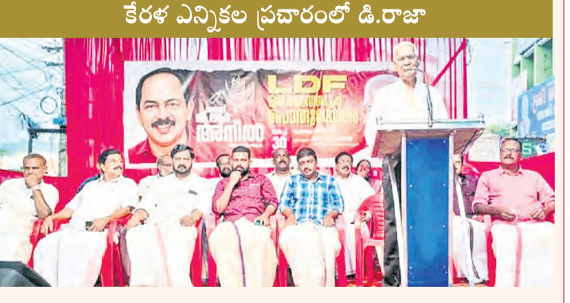
కేరళ ఎన్నికల ప్రచారంలో డి.రాజా

ఎల్డిఎఫ్కు పెరుగుతున్న ఆదరణతో యుడిఎఫ్, బిజెపి బెంబేలు కేరళలో మోడీ, యుడిఎఫ్ ఇరువురిని ఒకే రాజకీయ కీడు భాష, లక్ష్యాలు ఉన్నట్లు కనిపిస్తున్నాయని, ఎందుకంటే వీరిద్దరికీ అసలైన రాజకీయ ప్రత్యర్థి వామపక్ష ప్రజాశక్తి సంఘటన (ఎల్డిఎఫ్) మాత్రమేనని సిపిఐ జాతీయ ప్రధాన కార్యదర్శి డి.రాజా అన్నారు. కేరళలో ఎల్డిఎఫ్ను బలహీనపరిచేందుకు ఇరుపక్షాల నుంచి ప్రయత్నాలు జరుగుతున్నాయని ఆయన విమర్శించారు. కేరళ ప్రజలు వామపక్ష విధానంపై వదిలేడి విశ్వాసం ఉంచారు. అందుకే ఎల్డిఎఫ్ ప్రజల్లో తన బలమైన ఉనికిని కొనసాగించగలిగిందని ఆయన అన్నారు. కేరళ అభివృద్ధి సమూహ దేశానికి ఆదర్శమని అన్నారు. కేరళ శాసనసభ ఎన్నికల ప్రచారంలో భాగంగా నెడుమంగాడ్ నియోజకవర్గాల్లో జరిగిన ఎల్డిఎఫ్ సభలో డి.రాజా పాల్గొన్నారు. ఈ సందర్భంగా ఆయన ప్రసంగాన్ని ఎల్డిఎఫ్కు పెరుగుతున్న ఆదరణతో యుడిఎఫ్, బిజెపి రెండూ ఆందోళన