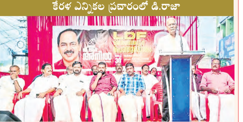
కేరళ ఎన్నికల ప్రచారంలో డి.రాజా

ఎలెడిఎఫ్ కు పెరుగుతున్న ఆదరణతో యుడిఎఫ్, బిజెపి బెంబేలు కేరళలో మోడీ, యుడిఎఫ్ ఇరువురివి ఒకే రాజకీయ ఘోషం ఉన్నట్లు కనిపిస్తున్నాయని, ఎందుకంటే వీరిద్దరికీ అసలైన రాజకీయ ప్రత్యర్థి వామపక్ష ప్రజాశక్తం నందేవులం (ఎలెడిఎఫ్) మాత్రమేనని సిపిఐ జాతీయ ప్రధాన కార్యదర్శి డి.రాజా అన్నారు. కేరళలో ఎలెడిఎఫ్ ను బలపరచేందుకు ఇరుపక్షాల నుంచి ప్రయత్నాలు జరుగుతున్నాయని ఆయన విమర్శించారు. కేరళ ప్రజలు వామపక్ష విధానాలపై వదిలేడి విశ్వాసం ఉంచారని, అందుకే ఎలెడిఎఫ్ ప్రజల్లో తన బలమైన ఉనికిని కొనసాగించగలిగిందని ఆయన అన్నారు. కేరళ అభివృద్ధి సమూహ దేశానికి ఆదర్శమని అన్నారు. కేరళ శాసనసభ ఎన్నికల ప్రచారంలో భాగంగా నెడుముండ్ గుమ్మం దర్గాహాలో జరిగిన ఎలెడిఎఫ్ సభలో డి.రాజా మాట్లాడారు. ఈ సందర్భంగా ఆయన ప్రసంగాన్ని ఎలెడిఎఫ్ కు పెరుగుతున్న ఆదరణతో యుడిఎఫ్, బిజెపి రెండూ ఆందోళన