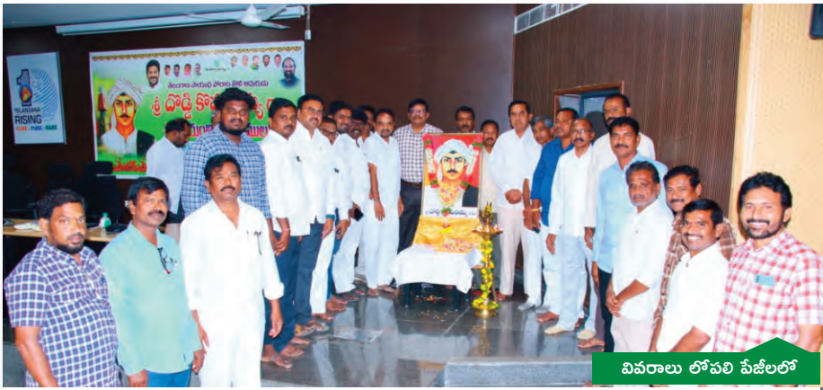
వివరాలు లోపలి పేజీలలో