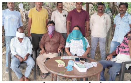
పరమైన చర్యల కోసం జక్రాన్ పల్లి పోలీస్ స్టేషన్ ఎస్ హెచ్ వోకి ఆప్పగించినట్లు పోలీసులు తెలిపారు.

ప్రజాపక్షం / నిజామాబాద్ అర్బన్ : పోలీసు కమిషనర్ సాయి చైతన్య ఆదేశాల మేరకు సిసిఎస్ ఏసిఎస్ మస్తాన్ అలీ ఆధ్వర్యంలో సిసిఎస్ సిబ్బంది పేకాట స్థావరంపై మెరుపు దాడి నిర్వహించి నలుగురు వ్యక్తులను నగదు రూ. 10,940 స్వాధీనం చేసుకున్నారు. పూర్తి వివరాలిక్కే వెలితే... జక్రాన్ పల్లి పోలీసుస్టేషన్ పరిధిలోని కలిగోట్ గ్రామ శివారులో నడుస్తున్న పేకాట స్థావరంపై శనివారం దాడిచేసి నలుగురు వ్యక్తులను అదుపులోకి తీసుకున్నారు. వీరి నుండి నాలుగు వాహనాలు, మూడు సెల్ ఫోన్లు రూ. 10,940 నగదు స్వాధీనం చేసుకున్నారు. పట్టుబడిన వ్యక్తులను, స్వాధీనం చేసుకున్న వస్తువులను తదుపరి చట్ట