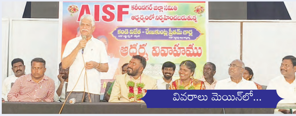
వివరాలు మెయిన్ లో...