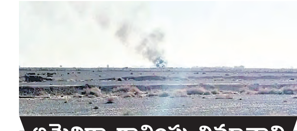
అమెరికా గాలింపు విమానాన్ని