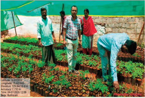
Latitude: 16.612956 Longitude: 79.627663 Elevation: 129.847089m Accuracy: 7.732 m Time: 04-07-2026 12:08 Name: Rudraram