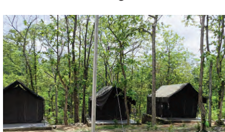
దుతన్నారని తెలుస్తోంది. ఇప్పటికైనా అటవీ శాఖ అధికారులు స్పందించి, తక్షణమే రక్షణ గోడ నిర్మించి ఈ వసతులను అందుబాటులోకి తీసుకురావాలని పర్యాటకులు కోరుతున్నారు. తద్వారా పర్యాటక రంగానికి ఊతం లభించడమే కాకుండా, ప్రభుత్వానికి కూడా ఆదాయం పెరుగుతుందని వారు పేర్కొంటున్నారు.

ప్రజాపక్షం/ నేరడిగొండ:తెలంగాణ నయాగారగా పేరు గాంచిన కుంటాల జలపాతం వద్ద పర్యాటకుల సౌకర్యాల లక్షల రూపాయలతో చేపట్టిన అభివృద్ధి పనులు వృధాగా మారుతున్నాయి. అటవీ శాఖ ఆధ్వర్యంలో పర్యాటకుల విడిది కోసం నిర్మించిన గెస్ట్ హౌసులు, రైన్ టెంటులు ఇప్పటికీ అందుబాటులోకి రాకపోవడంతో పర్యాటకులు అసహనం వ్యక్తం చేస్తున్నారు. కవ్వాల ట్రిగర్ జోన్ పరిధిలో ఉన్న ఈ ప్రాంతంలో పర్యాటక అభివృద్ధికి పలు నిర్మాణాలు చేపట్టినప్పటికీ, అవి పూర్తిస్థాయిలో వినియోగంలోకి రాలేదు. ముఖ్యంగా లక్షలు వెచ్చించి ఏర్పాటు చేసిన రైన్ టెంటుల రక్షణ గోడ లేకపోవడం ప్రధాన సమస్యగా మారింది. అటవీ ప్రాంతం కావడంతో విష సర్పాలు, వన్యప్రాణులు భయం పోంచి ఉందని, భద్రత లేని కారణంగా పర్యాటకులు వీటిని అద్దెకు తీసుకోవడానికి వెనకా