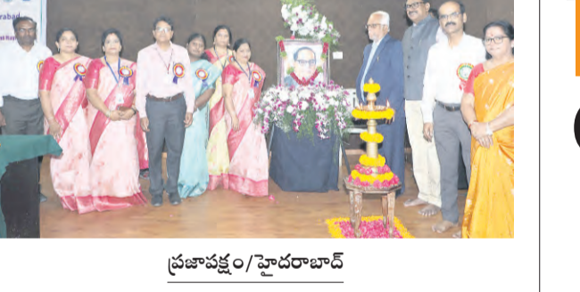
ప్రజాపక్షం / హైదరాబాద్

సుప్రీంకోర్టు రిటైర్డ్ న్యాయమూర్తి జస్టిస్ బి.సుదర్శన్ రెడ్డి