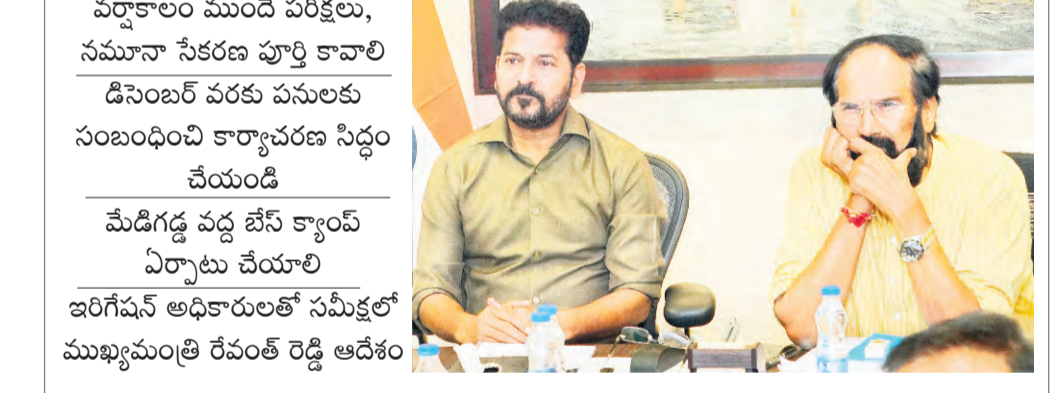
ప్రజాపక్షం / హైదరాబాద్

మద్రాసు ముందే పరీక్షలు, సమూహ సేకరణ పూర్తి కావాలి