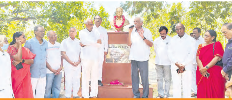
ప్రఖ్యాత కమ్యూనిస్టు చంద్ర రాజేశ్వర రావు