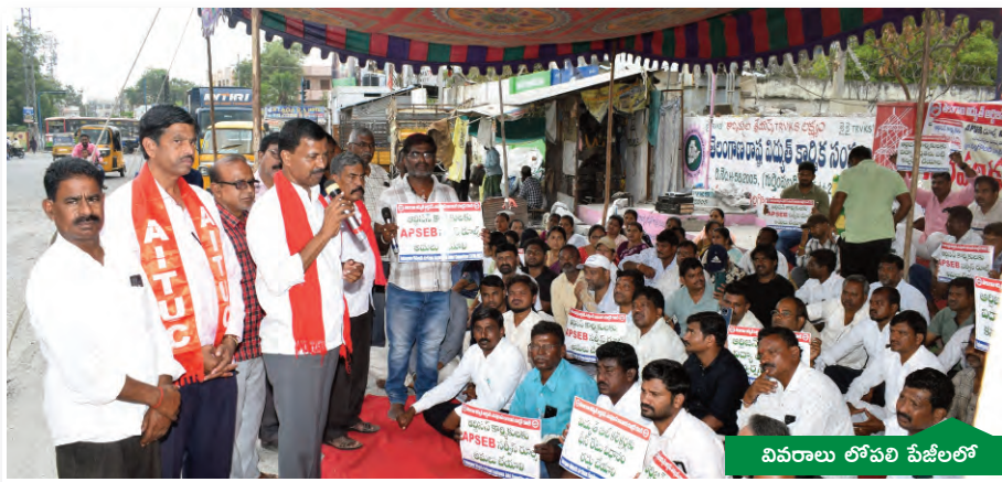
వివరాలు లోపలి పేజీలో

సమ్మెను అణచివేయడం కాదు.. చర్చలతో పరిష్కారం కావాలి