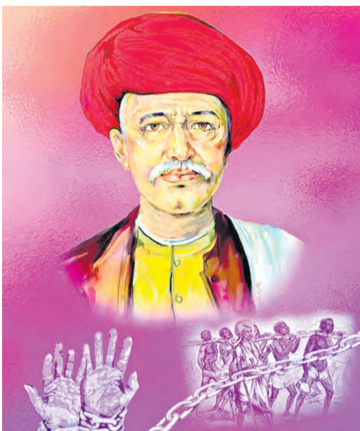
నేడు మహాత్మా జ్యోతిబాబు ఫూలే ద్విశతాబ్ది (200వ) జయంతి

చరిత్రలో కొందరు మహానీహారులు వ్యవస్థలను సవరించేయడానికి