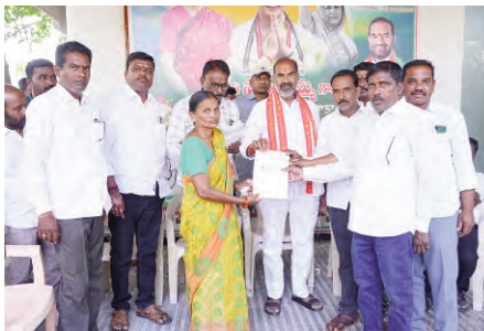
భ్యుడు ఆది శ్రీనివాస్ పంపిణీ చేశారు.

ప్రజాపక్షం/ వేములవాడ: వేములవాడ పట్టణంలోని ఎమ్మెల్యే క్యాంపు కార్యాలయంలో వేములవాడ రూరల్ మండల పరిధిలోని యాభై నాలుగు మంది లబ్ధిదారులకు పదిహేడు లక్షల ఎనభై వేల విలువ ముఖ్యమంత్రి సహాయ నిధి చెక్కులను రాష్ట్ర ప్రభుత్వ వివే వేములవాడ శాసనసభ