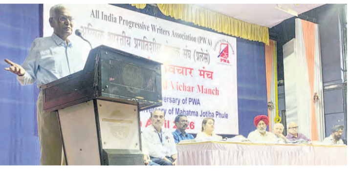
సిపిఐ ప్రధాన కార్యదర్శి డి.రాజా