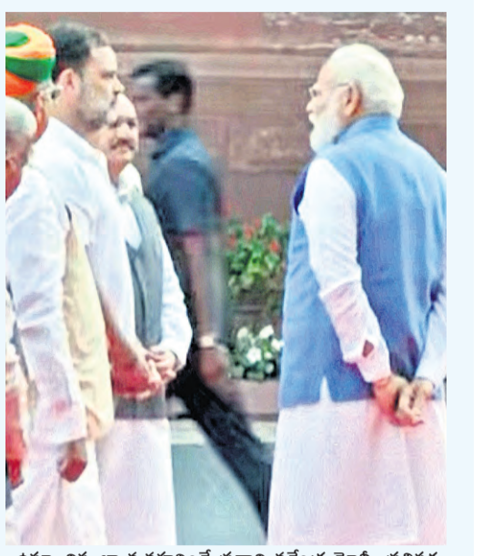
ఉప్పు నిప్పులా వ్యవహరించే ప్రధాని నరేంద్ర మోడీ, ప్రతిపక్ష నాయకుడు రాహుల్ గాంధీ శనివారం పార్లమెంట్ ఆవరణలో జోతిబా పూర్ జయంతి సందర్భంగా ఎదురెదురు పడ్డారు. ఈ సందర్భంగా కొద్దిసేపు వారు మాట్లాడుకున్న దృశ్యం సోషల్ మీడియాలో వైరల్ అయ్యింది. 05

● తొలుత 14న అమెరికాలో చర్చలకు నిర్ణయం ● హెబ్బోల్లా మౌలికీకరణతో చివరి నిమిషంలో ప్రయాణం వాయిదా వేసుకున్న లెబనాన్ ప్రధాని వాజిఫ్ వాజ్: పశ్చిమీయాల్ లో యుద్ధం ముగిసేందుకు ప్రధాన షరతుగా మారిన లెబనాన్ సమస్యపై ఈనెల 14వ తేదీ మంగళవారం వాషింగ్టన్ లో ఇజ్రాయేల్-లెబనాన్ ముఖాముఖీ సంభాషణలకు సిద్ధమయ్యాయి. కానీ చివరి నిమిషంలో లెబనాన్ ప్రధానమంత్రి నవాఫ్ సలామ్ చర్చలకు వెళ్ళకుండా అమెరికా పర్యటన వాయిదా వేకున్నట్లు లెబనాన్ రాత్రి పొద్దుపోయాక వార్తలు వెలువడ్డాయి. ఆయన ప్రకటనకు ముందుగా సోషల్ మీడియాలో ఇరాన్ సర్కారు నేత అంతర్జాతీయ వ్యవహారాల సలహాదారు ఒక పోస్టింగ్ పట్టారు. ఎంతో వీరోచితమైన హెబ్బోల్లా సైనికులను, వారి ప్రాతినిధ్యాన్ని పక్కనెట్టి, వారి త్యాగాలు, పోరాట పటిమను సులభమయిందా అమెరికాలో చర్చలకు వెళ్ళడం లెబనాన్ ను హుర్తిగా భద్రతా సమస్యల్లోకి నెట్టడమే అవుతుందని హెచ్చరిక జారీ అయ్యింది. అదేవిధంగా తరువాయి 2లో