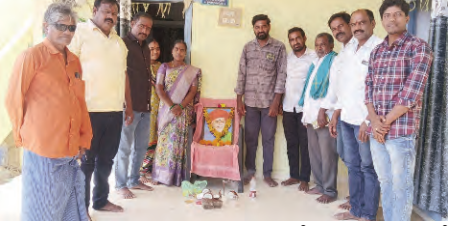
ప్రజాపక్షం/కమ్మర్పల్లి : మండలంలోని అన్ని గ్రామాల్లో గ్రామపంచాయతీ కార్యాలయంలో మహాత్మా జ్యోతిబా పూలే జయంతి వేడుకలు ఘనంగా నిర్వహించారు. ఈ సందర్భంగా సర్పంచ్లు, నాయకులు జ్యోతిబా పూలే చిత్రపటానికి పూలమాలలు వేసి నివాళులర్పించారు. సమాజంలో కుల, లింగ వివక్షతకు తావు లేకుండా అన్ని వర్గాలకు విద్యనందించాలని, విద్య ద్వారానే బలహీన వర్గాలు సామాజికంగా, ఆర్థికంగా అభివృద్ధి చెందుతాయని భావించిన వ్యక్తి పూలే అన్నారు. కార్యక్రమంలో వివిధ సంఘాల నాయకులు పాల్గొన్నారు.