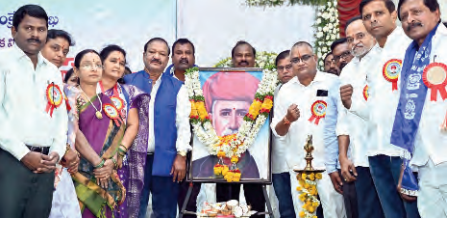
నిజామాబాద్ : మహాత్మా జ్యోతిబా పూలే జయంతి వేడుక