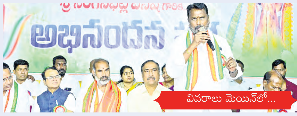
వివరాలు మెయిన్ లో...