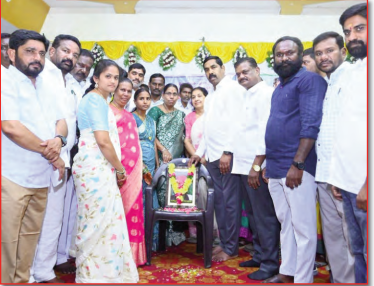
సమాన అవకాశాలు కల్పించే దిశగా ప్రజాప్రతినిధులు మాజీ ప్రజా ప్రతినిధులు అందరూ కలిసి పనిచేయాలని ఎమ్మెల్యే నాగరాజు పిలుపునిచ్చారు. ఈ కార్యక్రమంలో రులు పాల్గొన్నారు.

విద్యే సమాజ మార్పుకు ప్రధాన ఆయుధమని నమ్మి ప్రజల్లో చైతన్యం కలిగించిన మహానుభావుడు పూలే గారని ఆయన కొనియాడారు. నేటి సమాజంలో కూడా పూలే ఆలోచనలు ఎంతో ప్రాసంగికంగా ఉన్నాయని, సమానత్వం, సామాజిక న్యాయం, విద్యా విస్తరణ ఆయన చూపిన మార్గంలోనే సాధ్యమవుతాయని ఎమ్మెల్యే అన్నారు. ప్రజల సంక్షేమం, అణగారిన వర్గాల అభ్యున్నతి కోసం ప్రభుత్వం పలు సంక్షేమ కార్యక్రమాలను అమలు చేస్తోందని తెలిపారు. మహాత్మ జ్యోతిరావు పూలే ఆశయాలను స్ఫూర్తిగా తీసుకుని సమాజంలో ప్రతి ఒక్కరికీ