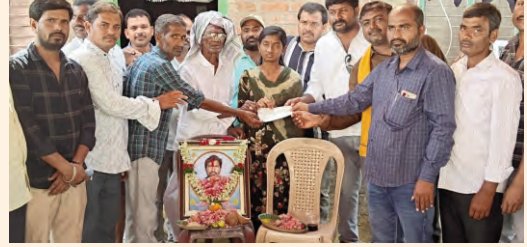
మిత్రుడి కుటుంబానికీ రూ,76 వేల ఆర్థిక సాయం