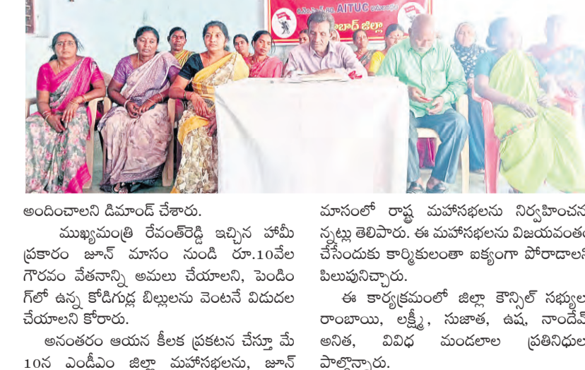
అందించాలని డిమాండ్ చేశారు. ముఖ్యమంత్రి రేవంత్ రెడ్డి ఇచ్చిన హామీ ప్రకారం జూన్ మాసం నుండి రూ.10వేల గౌరవ వేతనాన్ని అమలు చేయాలని, పెండింగ్ గోల్ డిస్కం కోడిగడ్డ బిల్లులను వెంటనే విడుదల చేయాలని కోరారు. అనంతరం ఆయన కీలక ప్రకటన చేస్తూ మే 10న ఎంపీల జిల్లా మహాసభలను, జూన్