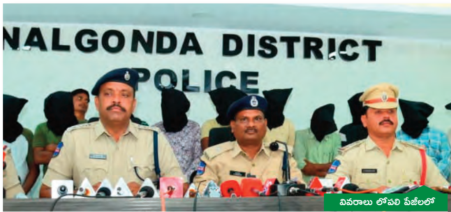
వివరాలు లోపలి పేజీలలో