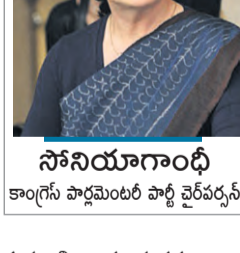
సోనియాగాంధీ కాంగ్రెస్ పార్లమెంటు పార్టీ చీఫ్ సర్పంచ్

మహిళా, పశ్చిమ ప్రదేశాలలో రాష్ట్రాలలో ఎన్నికల ప్రచారం ఉధృతంగా సాగుతున్న సమయంలో కేంద్ర ప్రభుత్వం పార్లమెంటు ప్రత్యేక సమావేశంలో బలవంతంగా ఆమోదించబడిన ఖామీ స్పష్ట బిల్లులకు మద్దతు ఇవ్వాలి ప్రధానమంత్రి ప్రతిపక్ష పార్టీలకు విజ్ఞప్తి చేస్తున్నాడు. ఈ అసాధారణమైన తొందరపాటుకు ఒక కారణం ఉండొచ్చు. అదేమిటంటే రాజకీయ లబ్ధి పొందడం, ప్రతిపక్షాన్ని అత్యర్థులలో పడేయడం. ప్రధాన మంత్రి ఎన్నికలలోని సజాన్ని మెకంగానే చెబుతున్నారు. 2023 సెప్టెంబర్ లో జరిగిన ప్రత్యేక సమావేశంలో నాటి శక్తి పంచన ఆధినియమే, 2023ను పార్లమెంటు ఏకగ్రీవంగా ఆమోదించింది. ఈ ఆధినియమే రాజ్యాంగంలో ఆర్టికల్ 334 ఎను ప్రవేశపెట్టింది. ఇది లోక్ సభ, విధాన (శాసన) సభలలో మహిళలకు మూడింట ఒక వంతు రిజర్వేషన్లను తప్పనిసరి చేసింది. అదేపని జనాభా లెక్కలు, జనాభా లెక్కల ఆధారిత నియోజకవర్గాల పునర్విభజన (డీపిబిఎఫ్) ప్రక్రియ పూర్తయిన తర్వాత ఇది అమల్లోకి రావాలి ఉంది. ప్రతిపక్షం ఈ పరతును కోరలేదు. వాస్తవానికి, రాజ్యాంగభంగ ప్రతిపక్ష నాయకుడు మర్రికాధర్స్ ఖర్జే, 2024 లోక్ సభ ఎన్నికల నుంచే రిజర్వేషన్ నిబంధనలను అమలు చేయాలని గట్టిగా డిమాండ్ చేశారు. ప్రభుత్వానికి మాత్రమే తెలిసిన కారణాల వల్ల, ఆ ప్రతిపాదనను అంగీకరించలేదు.