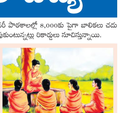
ప్రాచీన భారతదేశంలో మహిళల విద్య

సామాజిక వివక్ష మహిళల ఉన్నత విద్యకు పెద్ద అడ్డంకిగా నిలిచాయి. 1849లో కలకత్తా (నేటి కోల్కతా)లో నేటివ్ ఫిమేల్ స్కూల్ అనే మొదటి బాలికల పాఠశాల స్థాపించబడింది. తరువాత ఈ పాఠశాల 'బెభునే స్కూల్'గా మారింది. 1879లో ఇది 'బెభునే కాలేజీ'గా రూపాంతరం చెంది, ఆసియాలోనే పురాతన మహిళా కళాశాలగా నిలిచింది. 1878లో యూనివర్సిటీ ఆఫ్ కలకత్తా మహిళలను డిగ్రీ కోర్సుల్లో చేర్చిన మొదటి భారతీయ విశ్వవిద్యాలయంగా నిలిచింది. 1882లో కారంబినీ గంగాలీ, చంద్రముఖి బోస్ కలకత్తా విశ్వవిద్యాలయం నుండి బ్యాచులర్ ఆఫ్ ఆరట్స్ పట్టా పొందిన మొదటి మహిళలు అయ్యారు. 1913లో బరోడా కాలేజీలో ప్రవేశం పొందిన మొదటి మహిళగా హాంస మెహతాగారింపు పొందింది. 1916లో ధోండ్ కేవల్ కార్వే స్థాపించిన 'శ్రీమతి నధీబాయి దామోదర్ థాకెర్సే మహిళా రిజ్ కేవల్ భారతదేశ మొదటి మహిళా విశ్వవిద్యాలయంగా చరిత్రలో నిలిచింది.