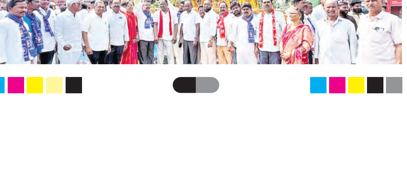
మహబూబ్ నగర్ లో...