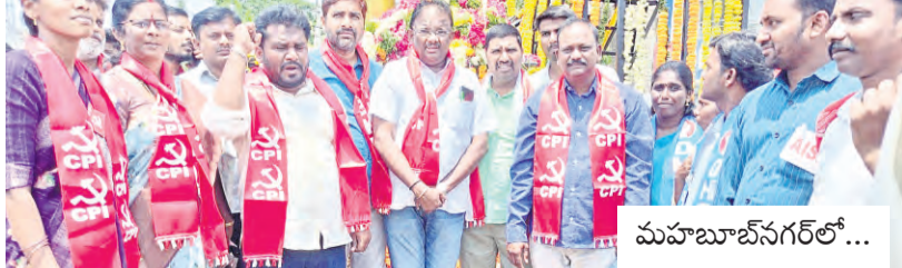
మహబూబ్ నగర్ లో...