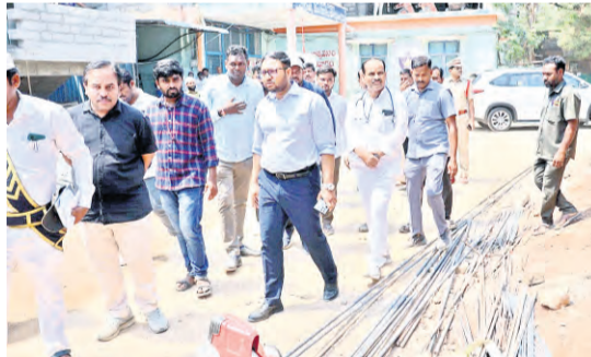
కోదాడ ఏరియా ఆసుపత్రి నిర్మాణ పనులను పరిశీలించిన జిల్లా కలెక్టర్

ప్రజాపక్షం/కోదాడ: ప్రజా సంక్షేమంలో భాగంగా ప్రజల ఆరోగ్యంపై ప్రభుత్వం ప్రత్యేక దృష్టి సారించింది ఇందులో భాగంగానే కోదాడ 100