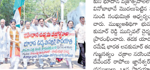
ప్రజాపక్షం/భూదాన్ పోచంపల్లి : భూదానోద్యమం 75 సంవత్సరాల పూర్తి చేసుకుంటున్న నేపథ్యాన్ని పురస్కరించు