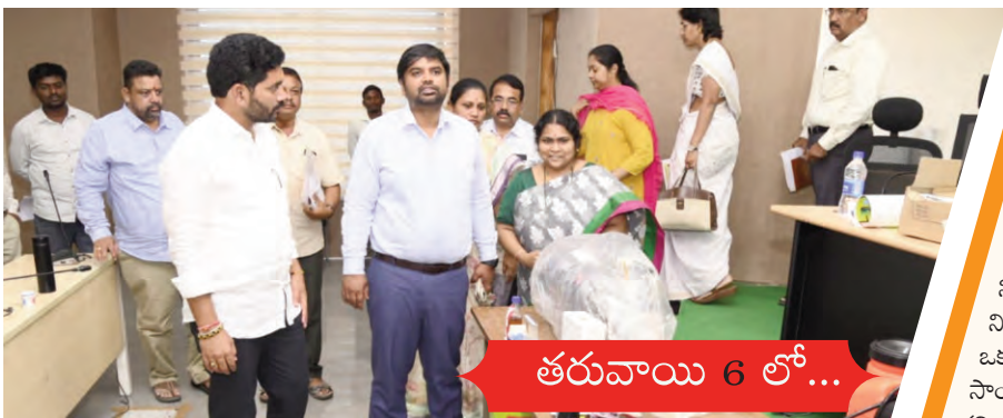
తరువాయి 6 లో...