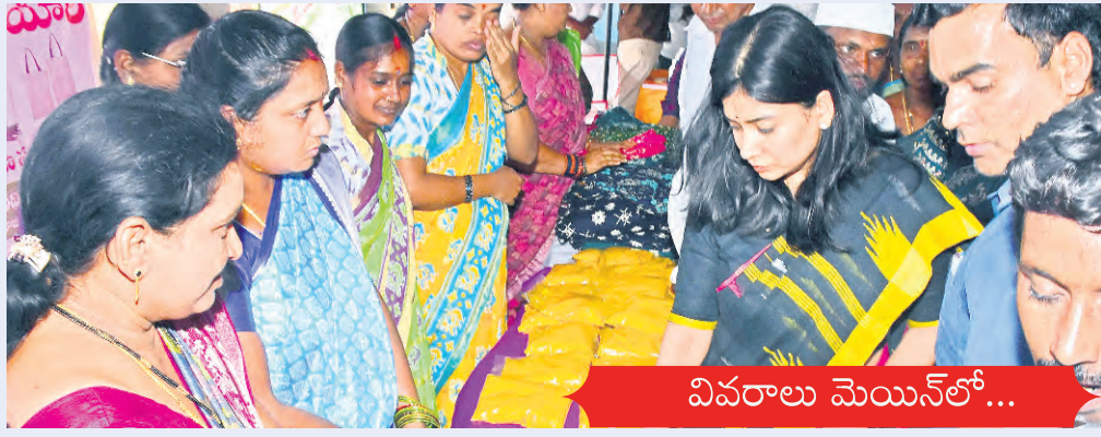
వివరాలు మెయిన్ లో...