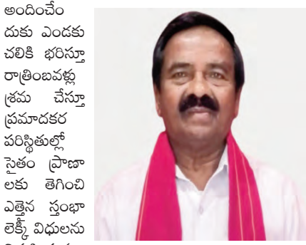
అందించేందుకు ఎండకు చలికి భరిస్తూ రాత్రింబవళ్లు శ్రమ చేస్తూ ప్రమాదకర పరిస్థితుల్లో సైతం ప్రాణాలకు తగిలించి ఎత్తైన స్తంభాలిక్కి విధులను నిర్వహిస్తున్న వీరి జీవితాల్లో వెలుగులు లేకపోవడం అత్యంత బాధాకరమన్నారు. విధి నిర్వహణలో ప్రాణాలు కోల్పోయిన వారు, అంగవైకల్యం చెందినవారు ఎందరో ఉన్నారని వారి కుటుంబాలు పడుతున్న బాధలు వర్ణనాతీతమన్నారు. ప్రభుత్వం సమ్మె చేస్తున్న కార్మికులను భయభ్రాంతులకు గురి చేయడం మానుకొని జెపీసి ప్రతినిధులతో ప్రజాస్వామ్యయుతంగా చర్చలు జరిపి వారి న్యాయమైన సమస్యల్ని పరిష్కరించి నమ్మెను విరమింప చేయాలని డిమాండ్ చేశారు.