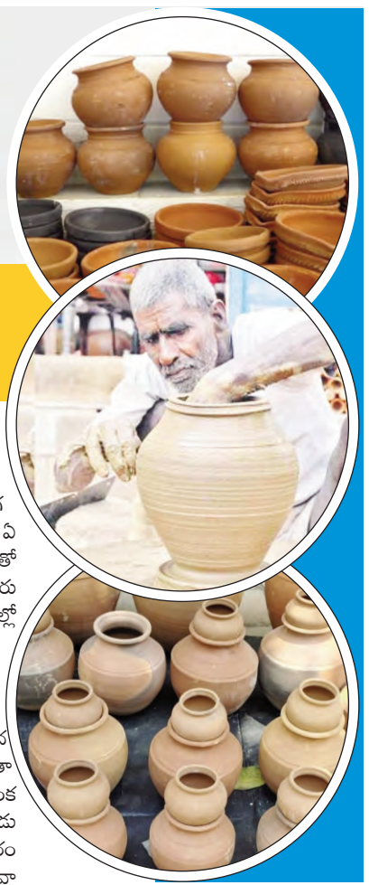
కుమ్మరుల బ్రతుకులు కూలీ కన్నా దారుణం