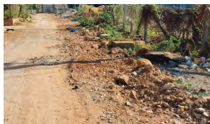
ముందే వేసిన పైవలైన్లతో ధ్వంసమైన రోడ్డు