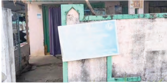
ప్రజాపక్షం/సత్తుపల్లి: సత్తుపల్లి ప్రాజెక్టు పరిధిలోని పలు అంగన్ వాడీ కేంద్రాల నిర్వహణ అంతంత మాత్రంగానే ఉందనే విమర్శలు బహిరంగంగానే వినిపిస్తున్నాయి.