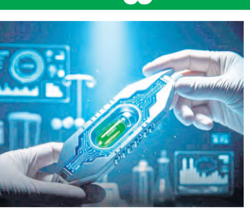
టైప్ 1 మధుమేహ రోగులపై ఇన్సులిన్ ఉత్పత్తి చేసే బీటా సెల్స్ను ని పునరుద్ధరించడానికి, రోగి స్వంత సైమ్ సెల్స్ను ఉపయోగించే దిశగా సాగుతున్నాయి.

ప్రారంభ దశలోనే ఉంది. ఎంతటి మధుమేహ బాధితుడైనా ఆరు నెలల్లో పూర్తిగా కోలుకుంటారంటూ వస్తున్న వార్తలను అతిశయోక్తులుగానే పరిగణించాలి.