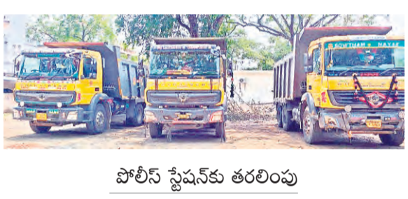
పోలీస్ స్టేషన్ కు తరలింపు